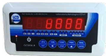
GCDESK-R Terminale elettronico