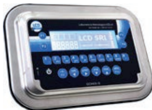
GCINOX-G Terminale in acciaio INOX