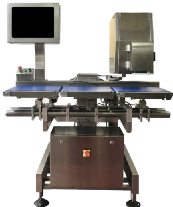
Sistemi di Etichettatura e Controllo EUROPE Automatico