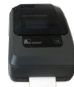
GC-GK420t Stampante etichette adesive Sticky labels printer