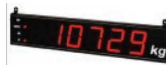
Ripetitore di peso Weight Repeater