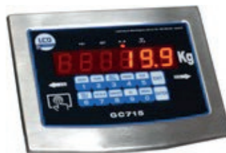
GC-715 Terminale in acciaio INOX