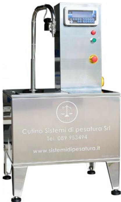
Riempilattina per liquidi alimentari Riempi-Lux 18

Can filling machine for weighing Riempi-Lux 18