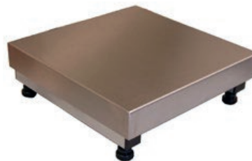
GC-MLC Piattaforma di pesatura Weighing platform