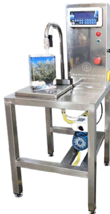
Riempilattina per liquidi alimentari Riempi-Lux B

Can filling machine for weighing Riempi-Lux 18