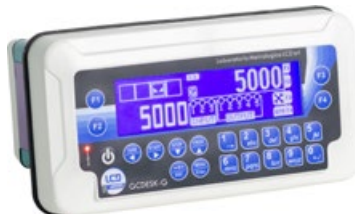
GCDESK-G Terminale elettronico