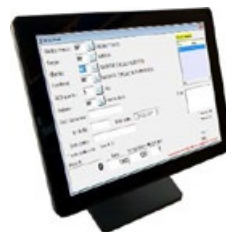
Terminale / Terminal GC-TouchScreen