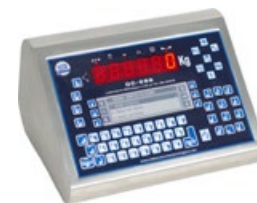
Terminale / Terminal GC-LA 688