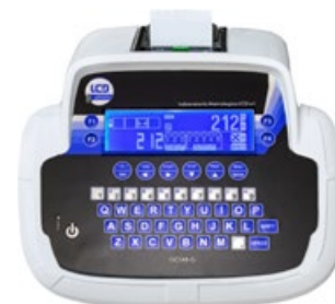
GCTAB-G Terminale elettronico